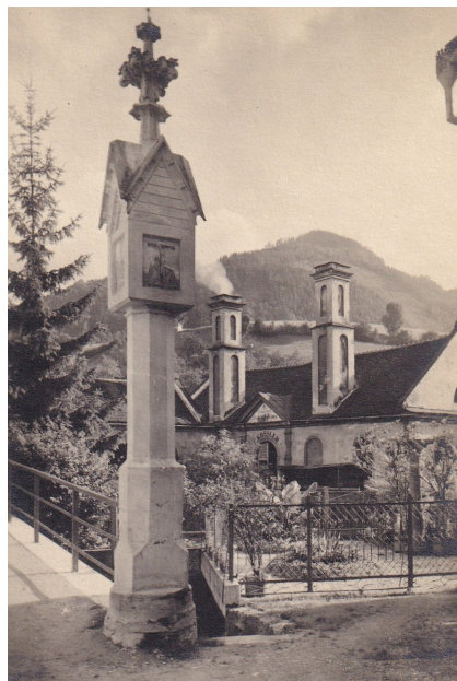
Pestsäule, damals noch bei der Hafner-Brücke, Ansichtskarte von 1916.

Weiter im Osten dagegen sah es ganz anders aus. Nach einer Verlustliste über das Amt Lanzendorf bei Böheimkirchen vom 20. September 1683 (acht Tage nach dem Sieg vor Wien) und einer Beschreibung der Untertanen von 1684 waren 124 der ursprünglich 177 Einwohner verloren gegangen. Davon werden nur 15 ausdrücklich als umgekommen bezeichnet, das heißt, ihre Leichen wurden gefunden und identifiziert, bei 45 gab es Zeugen, dass sie hinweggeführt wurden, mehr als die Hälfte wurde als verloren bezeichnet, das heißt, man konnte nicht sagen, was aus ihnen geworden ist.